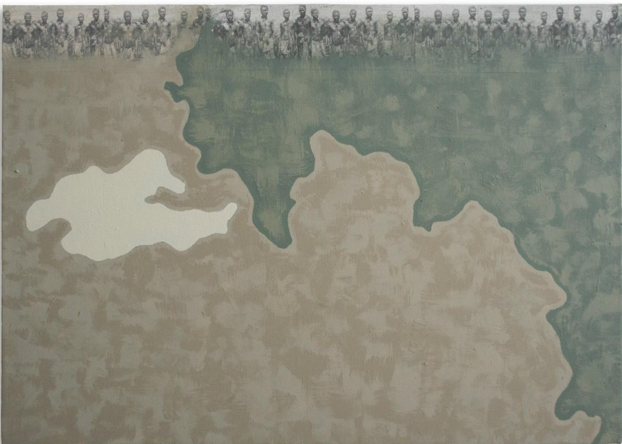
Zaślepanie I (Kongo, 1885 – 1906) / Blinding I (Congo, 1885-1906), 2013 – 2016, akryl na płótnie, wydruki na papierze / acrylic on canvas, prints, 63 x 90 cm